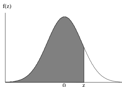
Tablica I - Površina ispod normalne krive (n>30)